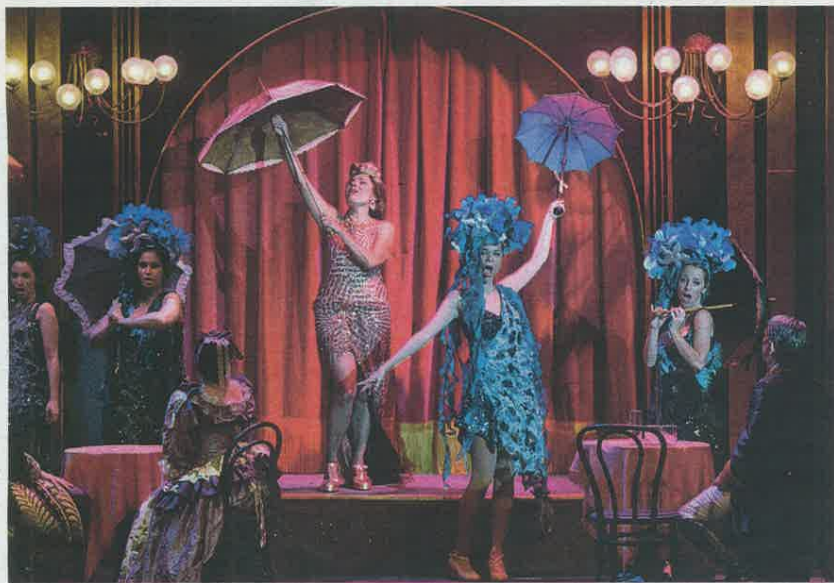
La Cocotero, rodeada por las pantaloneras.